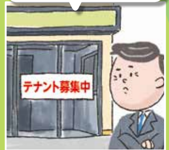
テナント・マンション