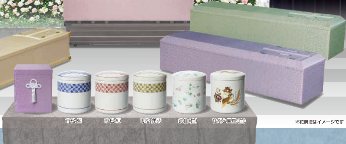
市松藍 市松紅 市松抹茶 鉄仙(白) 牡丹と鳳凰(白)