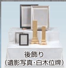
後飾り (遺影写真・白木位牌)